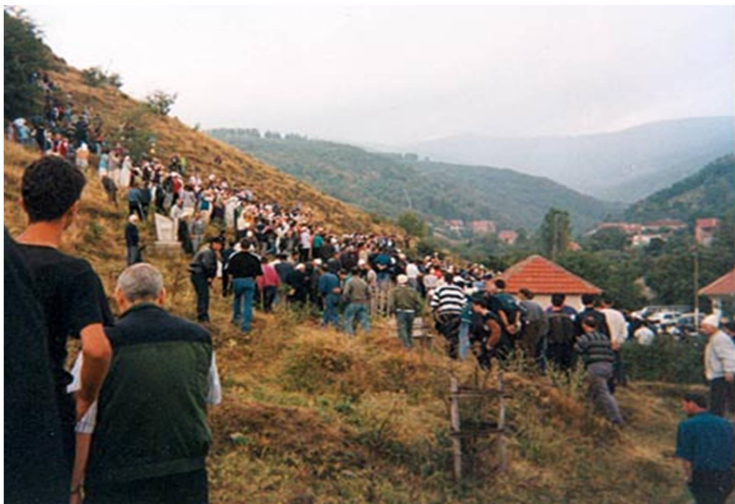
Momente nga rivarrimi i viktimave të luftës në fshatin Vraniq.