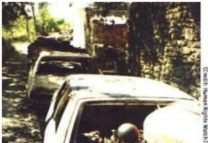
Pamje  nga gjendja në fshatin Vraniq, shtator 1998.