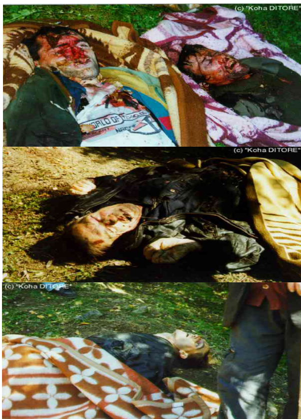
Shqiptarë të vvarë e të masakruar në ofensivën serbe, në Vraniq - shtator 1998.