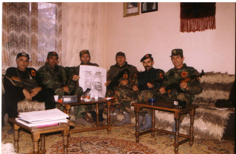
Pjestarë të Batalionit II, gjat një vizite në Brigadën 161 “Ahmet Kaqiku”, në Zonën Operative të Neredimës