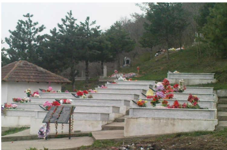
Varrezat e viktimave civile të luftës në fshatin Vraniq.