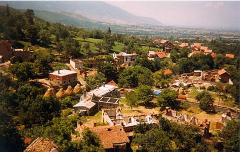
Pamje të pjesëve të fshatit Vraniq në pasluftë.