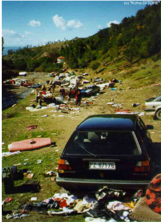
Pamje nga vendi ku kishte qëndruar popullate, në “Lumi i Madh”; marrë nga “Koha Ditore”.