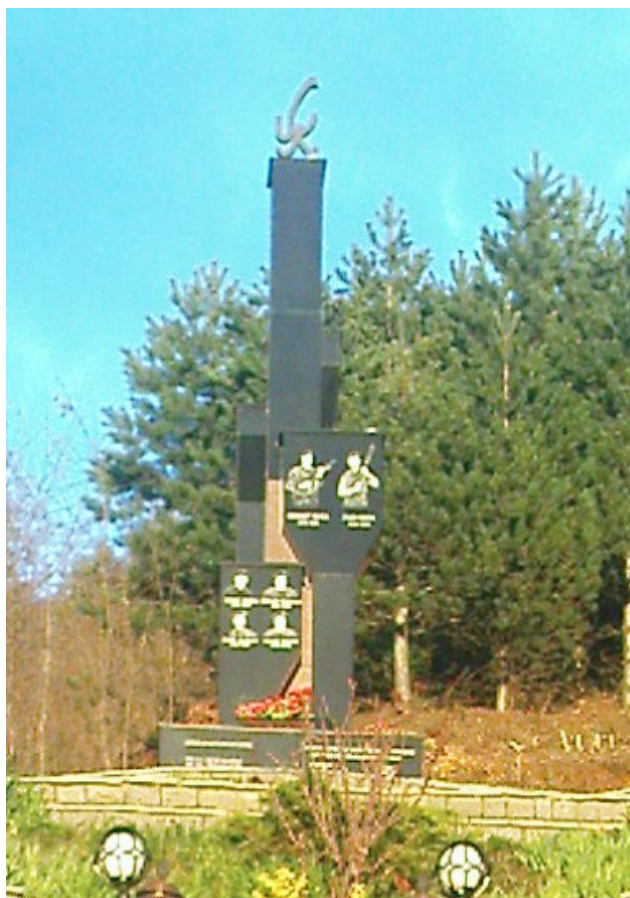
Lapidari kushtuar Dëshmorëve të Kombit, në fshatin Vraniq.