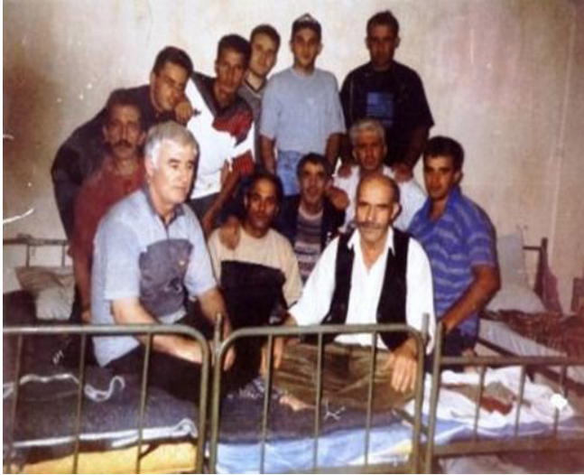
Grup robërisht të luftës nga fshati Vraniq, në burgun e Prokupjes.