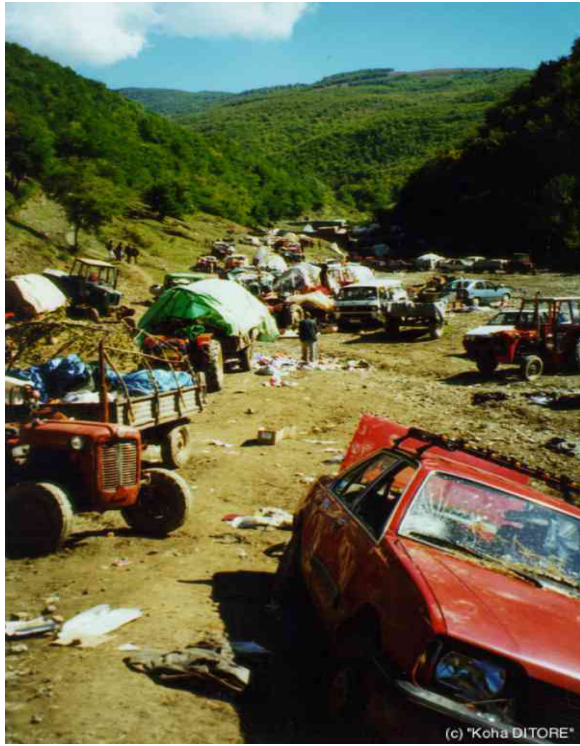
Pamje nga vendi ku kishte qëndruar popullate, në “Lumi i Madh”; marrë nga “Koha Ditore”.