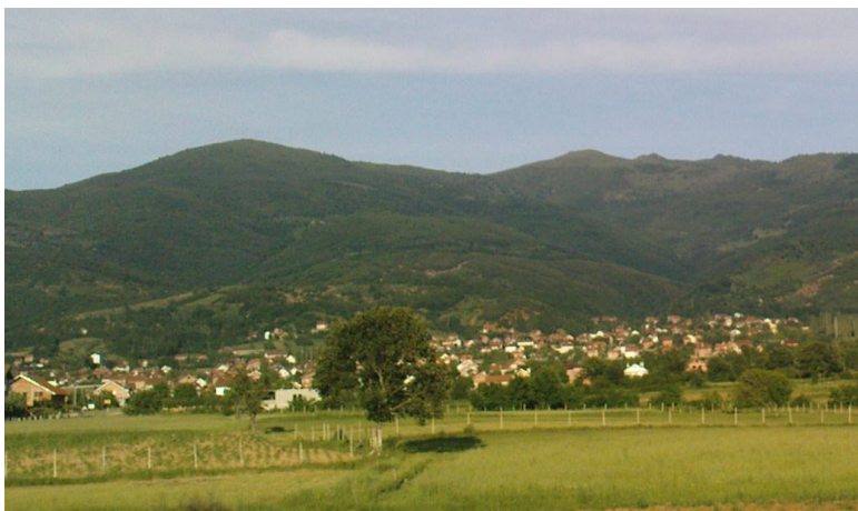
Fshati Vraniq (Verë 2011)